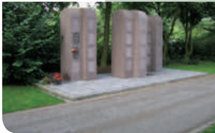
Urnenkammer mit individueller Verschlussplatte