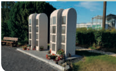
Urnenkammer mit vorgegebener Verschlussplatte